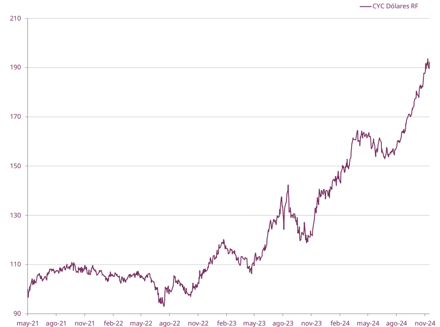
EVOLUCIÓN DE CUOTAPARTE DESDE INICIO